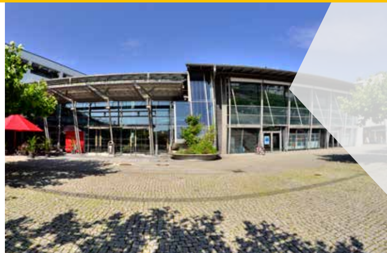
Stadthalle Germering – Haupteingang

Auch das Cineplex in Germering bietet eine interessante Alternative zum herkömmlichen Kinobesuch.