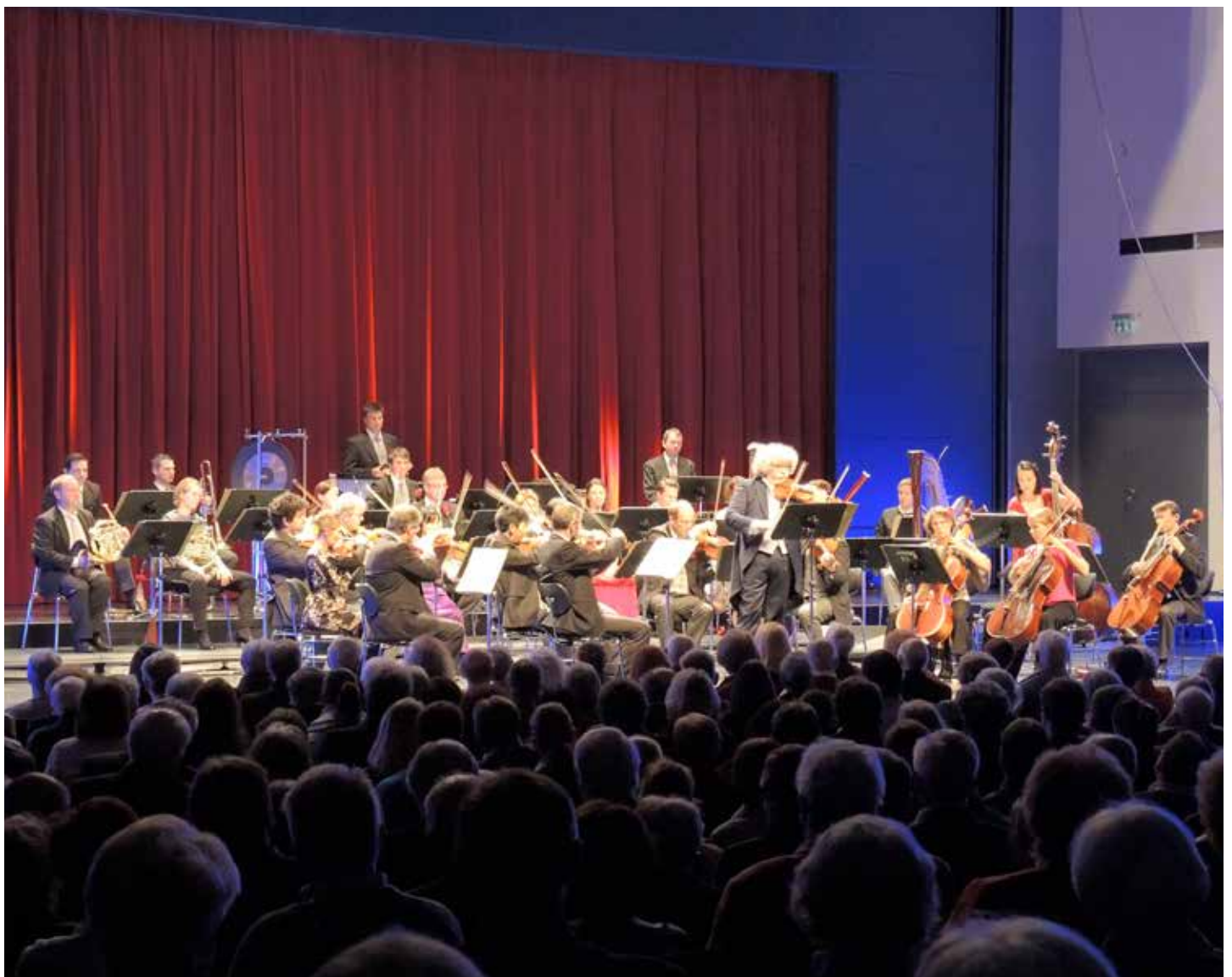
Neujahrskonzert 2018