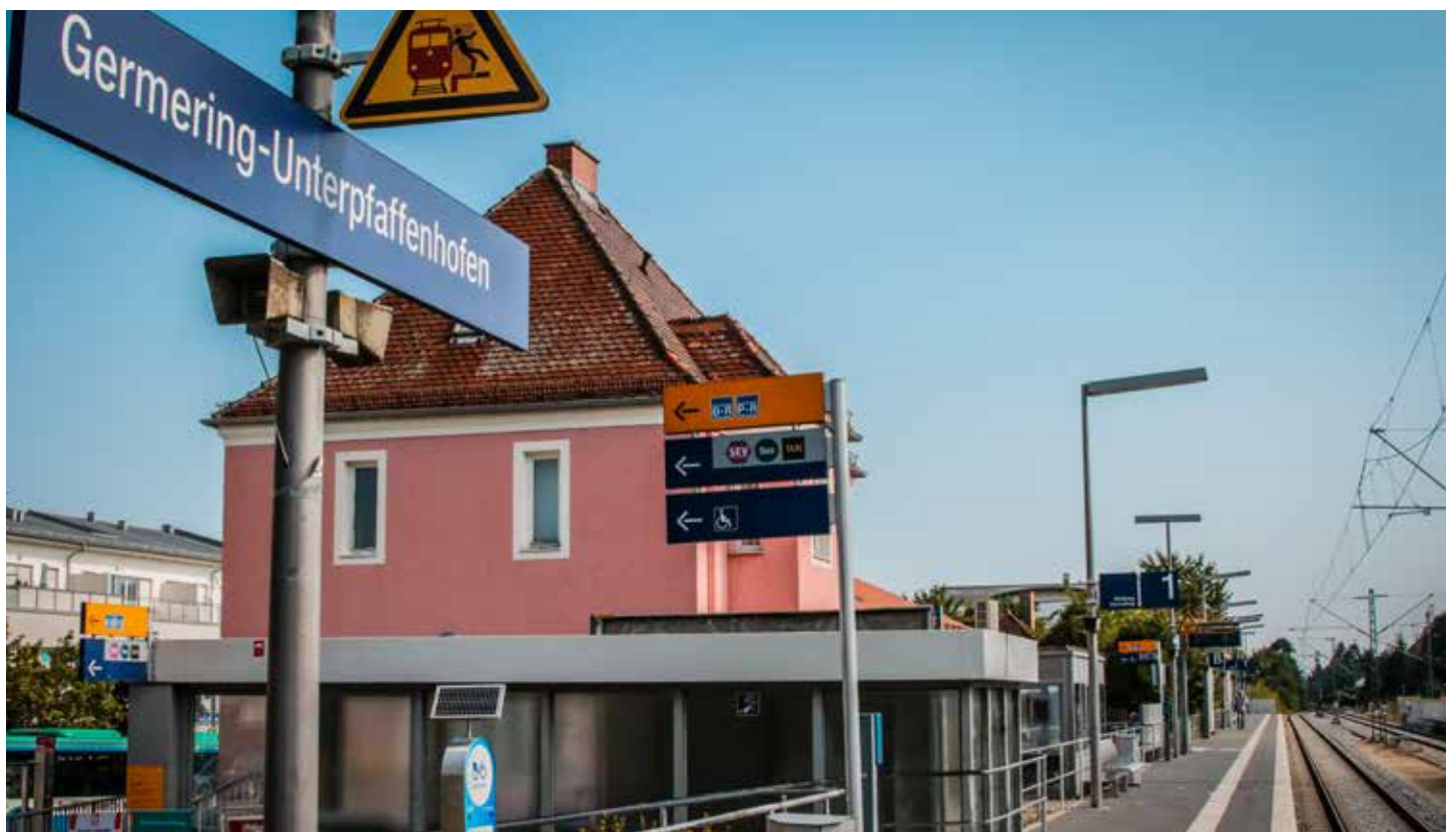
Unterpfaffenhofen – Bahnhof

Dies ist nur ein kleiner Querschnitt der Germeringer Gaststätten, der keinen Anspruch auf Vollständigkeit erhebt.