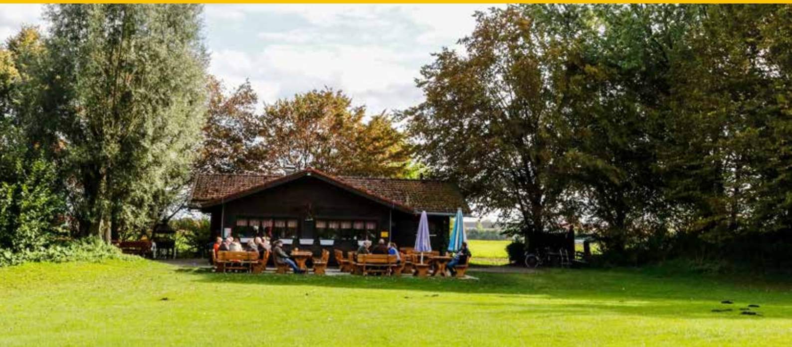
Kiosk am See

Jeder zweite Mittwoch des Monats um 14:30 Uhr ab 14:00 Uhr Kaffee und Kuchen www.cineplex.de/germering Münchener Straße 1 (im GEP) 82110 Germering Telefon: 089 244113500